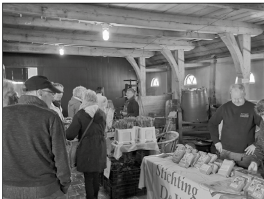
impresie van de Streekmarkt 2025

Op paaszaterdag, 4 april, openen we feestelijk het nieuwe seizoen van Museumboerderij Welgelegen met een sfeervolle streekmarkt vol lekkers en ambachtelijks uit de regio. Kom genieten van de geur en proef