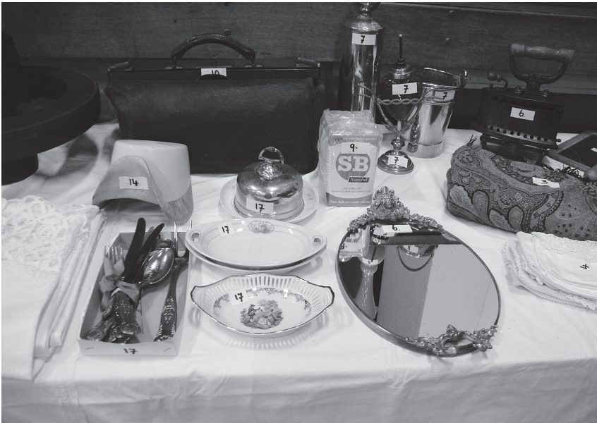
Ingebrachte kavels voor de veiling

Meer informatie: www.westfriesgenootschap.nl , knop Kap en Dek.